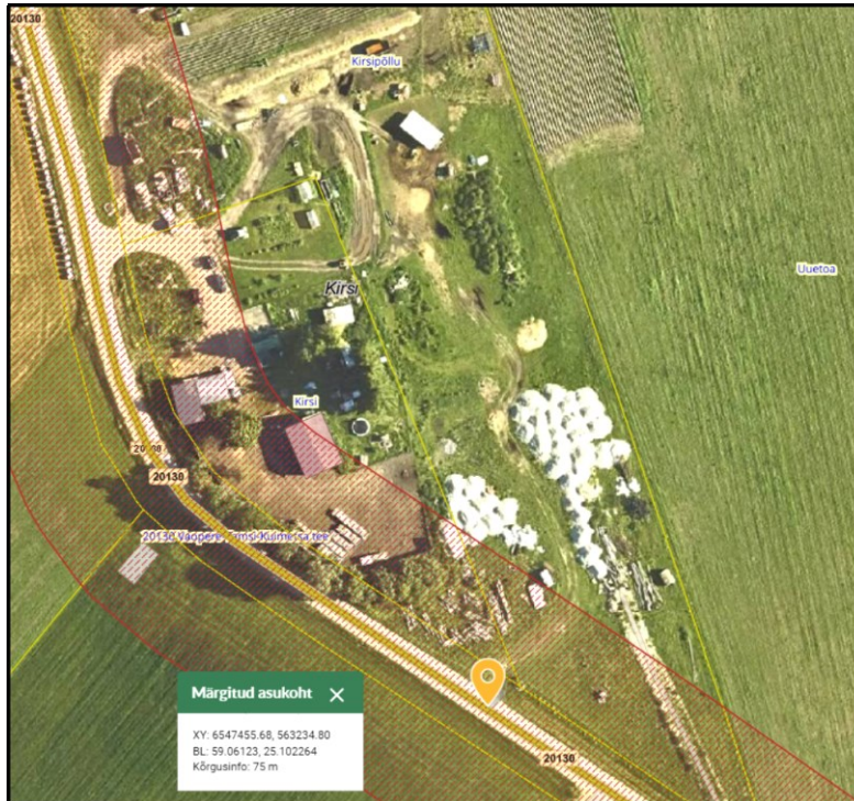
Joonis 1. Ristumiskoha asukoht tähistatud oranži tingmärgiga